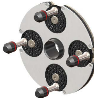
Вариаторный адаптер QuickPlate III (для 4-х крепежных отверстий) Part-#: 249 010 400