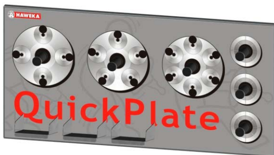
Настенный дисплей с кронштейнами Part-#: 900 008 151