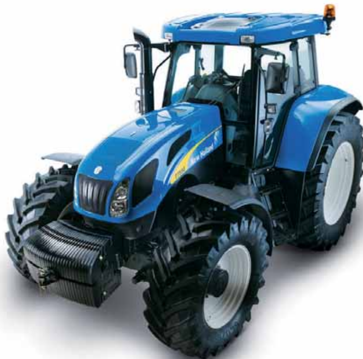
AXIS50 LM и RPV1300 для тракторов и сельскохозяйственной техники.